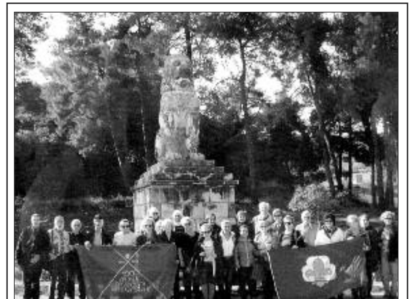
Η ΧΟΡΩΔΙΑ ΠΑΛΑΙΩΝ ΠΡΟΣΚΟΠΩΝ ΚΑΙ ΟΔΗΓΩΝ ΘΕΣΣΑΛΟΝΙΚΗΣ ΕΠΙΣΚΕΦΘΗΚΕ ΤΟ ΣΑΒΒΑΤΟ 11/10/2014 ΤΟΝ ΑΡΧΑΙΟΛΟΓΙΚΟ ΧΩΡΟ ΚΑΙ ΤΟ ΜΟΥΣΕΙΟ ΤΗΣ ΑΜΦΙΠΟΛΗΣ ΚΑΘΩΣ ΕΠΙΣΗΣ ΚΑΙ ΤΟ ΣΠΗΛΑΙΟ ΤΩΝ ΠΑΓΩΝ ΤΟΥ ΠΟΤΑΜΟΥ ΑΓΓΙΤΗ, ΜΕ ΣΥΜΜΕΤΟΧΗ 43 ΑΤΟΜΩΝ